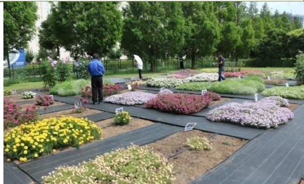
▲千葉大の審査花壇の様子

*千葉大への苗の搬入可能日は、毎週火曜日午前中となります。 （苗の納入日は変更になる場合があります）