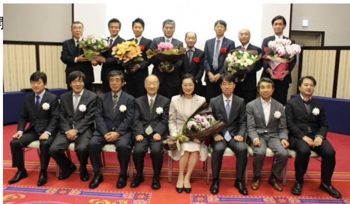
日本フラワー・オブ・ザ・イヤー2016授賞式(学士会館)